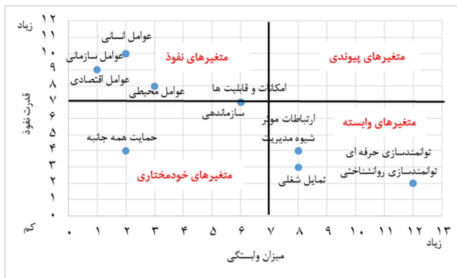
نمودار ۱- قدرت نفوذ و میزان وابستگی (نمودار MICMAC) (طراحی نگارندگان)

مصاحبه‌شوندگان به‌عنوان عامل تاثیرگذار سطح بندی شد. کوئین و اسپریتزر (Quinn & Spreitzer) (۲۰۰۱) در پژوهشی بیان کردند، تغییرات عمده‌ای در شکل سنتی سازمان‌های دارای ساختار سلسله‌مراتبی و قدرت متمرکز در رأس هرم در حال رخ دادن است. به اعتقاد بسیاری از مدیران عالی در محیطی که شدت رقابت جهانی و فناوری‌های نوین از ویژگی‌های آن به شمار می‌آیند، دست برداشتن از کنترل متمرکز و عوامل بازدارنده می‌تواند باعث افزایش انعطاف‌پذیری سازمان شده و در این میان بهترین راه برای توانمندسازی عدم تمرکز است؛ که با یافته‌های پژوهش حاضر هم‌راستا است (۱۱). بر اساس پژوهشی مسکین‌نواز و همکاران (۲۰۱۷) دریافتند که بارزترین سرمایه سازمان‌ها منابع انسانی خلاق و توانمند و مستعد است. بر اساس یافته‌های پژوهش حاضر نیروی انسانی باشگاه به‌عنوان یک رکن اصلی، تشکیل‌دهنده هویت باشگاه می‌باشد که مدیریت باشگاه باید توجه خاصی به این مهم داشته باشد. توانمندسازی روانشناختی منابع انسانی شاید در ابتدا همراه با هزینه‌های زمانی و مالی برای مدیران باشگاه‌های حرفه‌ای ورزش باشد؛ ولی در آخر نتیجه آن بالا رفتن اثربخشی و افزایش بهره‌وری در باشگاه‌های حرفه‌ای ورزش ایران می‌باشد. توانمندسازی روانشناختی منابع انسانی باشگاه‌ها می‌تواند اهداف فردی و سازمانی باشگاه‌های حرفه‌ای ورزش را همسو کند و منابع انسانی