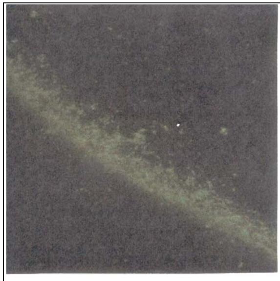
شکل شماره ۲ - آنتی‌بادی IgM مثبت کلامیدیا تراکوماتیس در زنان مبتلا به سرویسیت با روش MIF (بزرگنمایی \times 40 )

۱۳/۱٪ افراد مثبت گردیده است. تفاوت نتیجه بدست آمده از نظر آماری معنی‌دار می‌باشد ( P < 0.039 ) (جدول شماره ۲). در روش میکروایمونوفلئورسانس، با استفاده از میکروسکوپ ایمونوفلئورسانس، موارد مثبت آنتی‌بادی کلامیدیا تراکوماتیس به صورت نقاط سبز رنگ فلئورسانس شدند (شکل شماره ۱ و ۲).