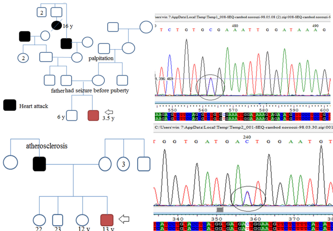
شکل ۲- الف) جایگاه واریانتهتروزیکوت (c.22A>G) در سکاس بیمار شماره ۵۰ به همراه شجره نامه. ب) جایگاه واریانته (c.170T>C) در سکاس بیمار به همراه شجره نامه.

تهران با سابقه سنکوپ، صرع و مصرف داروی پروپرانولول به میزان ۱۰ میلی گرم هر ۸ ساعت (Schwartz score 5) است. با مطالعه شجرنامه بیمار شماره ۵۰ متوجه شدیم ۳ نفر از اعضای خانواده او دچار حمله قلبی شدند که یک نفر از آن ها در ۱۶ سالگی فوت شده همچنین پدر پروباند نیز قبل از بلوغ دارای حملات صرعی بوده است (شکل ۲).