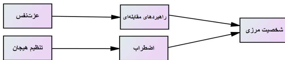
نمودار ۱- مدل مفهومی ارتباط بین متغیرهای مورد بررسی

تحلیل عاملی اکتشافی، تحلیل عاملی تأییدی، و مدل معادلات ساختاری تجزیه و تحلیل گردید.