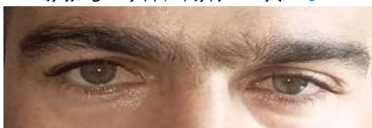
شکل ۳- از بین رفتن آنیزوکوریا و کاهش پتوز پس از شروع درمان