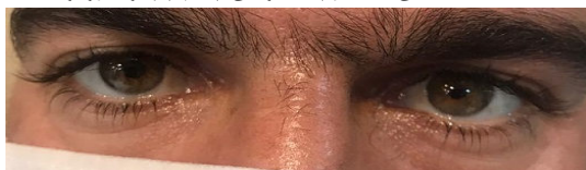
شکل ۲- بهبود مختصر پتوز چشم چپ و کاهش آنیزوکوریا