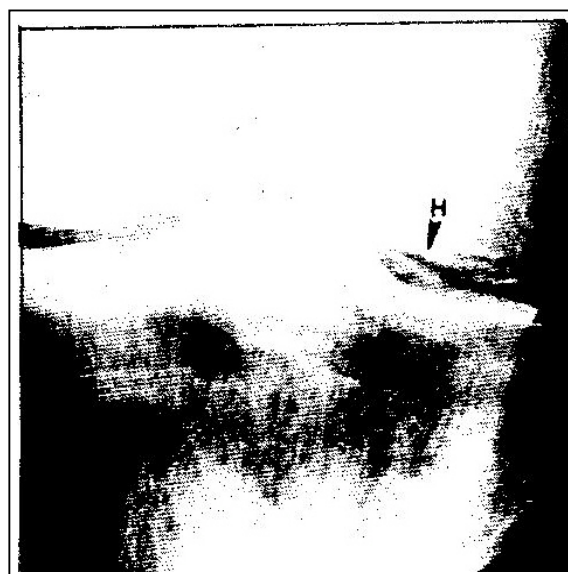
شکل شماره ۱- کندرو کلسینوز زانو

محل شایع آن در مفصل زانو است (۲، ۳ و ۴). در بررسیهایی که از نظر شیوع در زن و مرد انجام شده نتایج متفاوتی به دست آمده است.