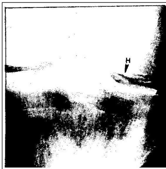
شکل شماره ۱- کندرو کلسینوز زانو

محل شایع آن در مفصل زانو است (۲، ۳ و ۴). در بررسیهایی که از نظر شیوع در زن و مرد انجام شده نتایج متفاوتی به دست آمده است.