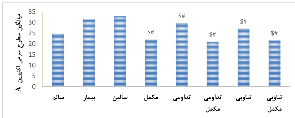
شکل ۲- تغییرات سطوح سرمی اکتیوین-A در گروه‌های مختلف

(# وجود تفاوت معنی‌داری بین گروه بیمار با دیگر گروه‌ها)