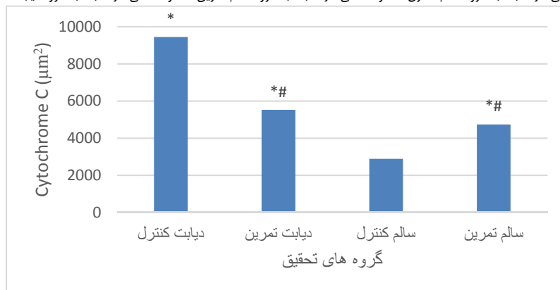
نمودار ۳- تغییرات سیتوکروم C بافت نخاعی موش‌های صحرایی در گروه‌های تحقیق

تفاوت معنی دار نسبت به گروه سالم کنترل*؛ تفاوت معنی دار نسبت به گروه سالم تمرین#؛ تفاوت معنی دار نسبت به گروه دیابت کنترل&