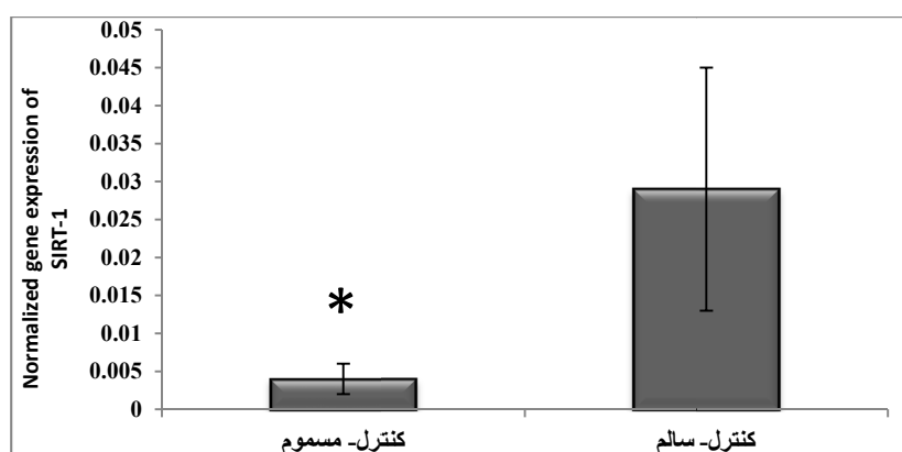
شکل ۱- بیان ژن SIRT-1 در گروه کنترل سالم و کنترل مسموم شده با روغن حرارت دیده عمیق *نشانه کاهش معنی دار نسبت به گروه کنترل سالم

نتایج آزمون تی مستقل، کاهش معنی دار بیان ژن