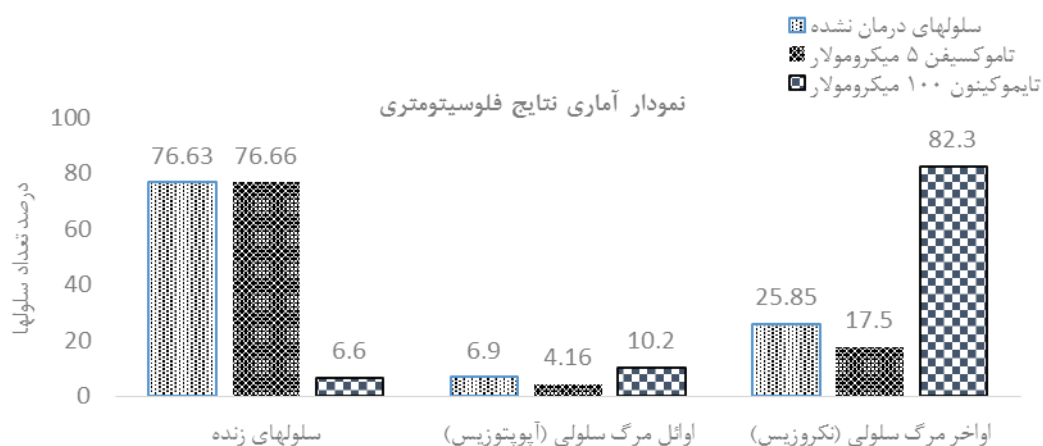
تصویر ۳- کاهش درصد سلولهای زنده بعد از ۲۴ ساعت درمان با تایموکینون ۱۰۰ میکرومولار در مقایسه با سلولهای تیمار نشده و تاموکسیفن ۵ میکرومولار. همچنین افزایش درصد سلولها در اوائل مرحله سلولی و بطور معناداری در اواخر مرحله سلولی با نمونه تایموکینون دیده می شود.