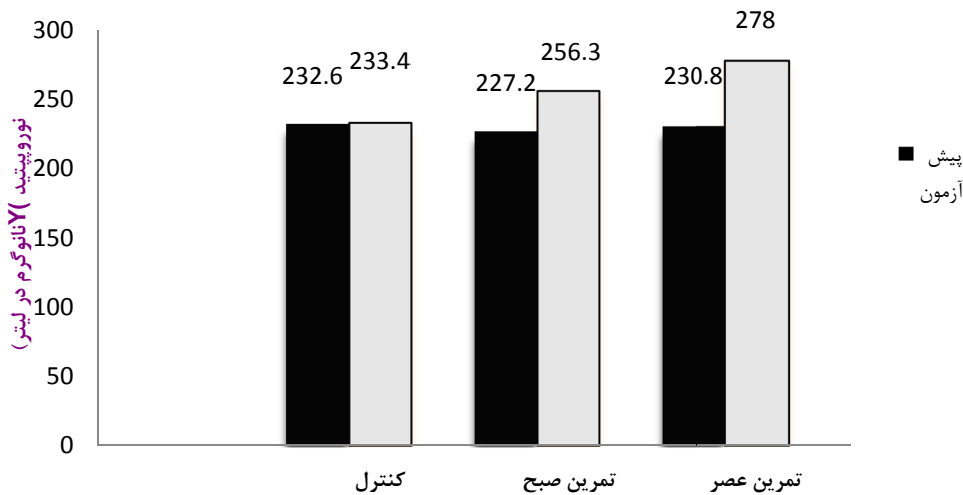
نمودار ۲- مقایسه سطوح نوروپپتید Y پس از هشت هفته تمرین هوازی در گروه های مورد مطالعه

شده مربوط به شیفت خون یا ریتم شبانه روزی می باشد (۲۰). نتایج مطالعات متعدد نشان داده اند که رژیم غذایی و فعالیت ورزشی می تواند منجر به کاهش مقادیر لپتین گردد و از آنجا که فعالیت ورزشی هوازی موجب کاهش وزن و چربی بدن می شود، چنانچه مقادیر لپتین در پاسخ به تمرین هوازی کاهش یابد، این موضوع می تواند توضیحی باشد بر این که تمرینات هوازی به چه صورت بر چاقی اثرگذار می باشند (۲۱). علاوه بر این، هورمون های کورتیزول و رشد، از جمله مهم ترین هورمون های مؤثر بر افزایش مقادیر لپتین هستند که تحت تأثیر ریتم شبانه روزی قرار دارند (۲۲). کمترین غلظت لپتین در ظهر و بیشترین آن در نیمه شب است.