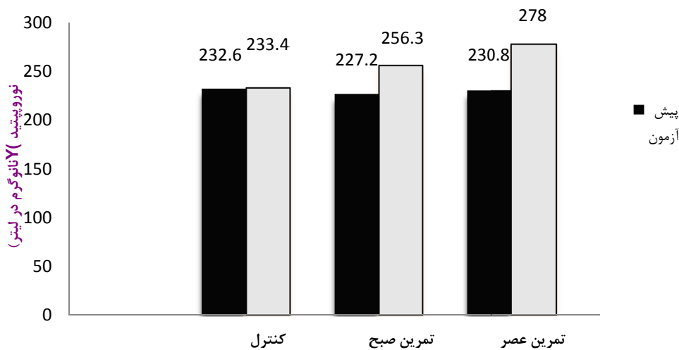
نمودار ۲- مقایسه سطوح نوروپیتید Y پس از هشت هفته تمرین هوازی در گروه های مورد مطالعه

شده مربوط به شیفت خون یا ریتم شبانه روزی می باشد (۲۰). نتایج مطالعات متعدد نشان داده اند که رژیم غذایی و فعالیت ورزشی می تواند منجر به کاهش مقادیر لپتین گردد و از آنجا که فعالیت ورزشی هوازی موجب کاهش وزن و چربی بدن می شود، چنانچه مقادیر لپتین در پاسخ به تمرین هوازی کاهش یابد، این موضوع می تواند توضیحی باشد بر این که تمرینات هوازی به چه صورت بر چاقی اثرگذار می باشند (۲۱). علاوه بر این، هورمون های کورتیزول و رشد، از جمله مهم ترین هورمون های مؤثر بر افزایش مقادیر لپتین هستند که تحت تأثیر ریتم شبانه روزی قرار دارند (۲۲). کمترین غلظت لپتین در ظهر و بیشترین آن در نیمه شب است.