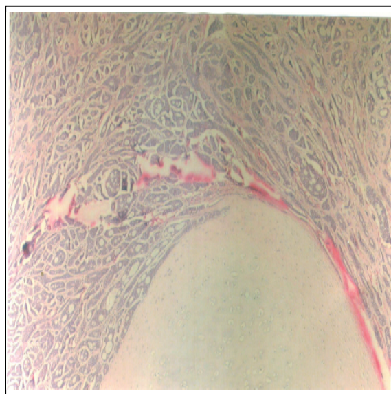
شکل شماره ۲- نمای میکروسکوپی آدنویید کیستیک کارسینوما با تهاجم به غضروف تراشه (بزرگنمایی ۱۰×)

صورت گرفت. مارژین منفی در بافتهای اطراف توسط فروزن سکشن گزارش گردید. در گزارش پاتولوژی permanent بیمار، ابعاد تومور ۱×۱×۲/۵ سانتی‌متر همراه تهاجم به Ant.commissure، FVC (False vocal cords) و TVC (True vocal cords) و درگیری غضروفی (شکل شماره ۲) و بافت نرم پری‌لارنژیال همراه تهاجم پری‌نورال (شکل شماره ۳) بدون درگیری عروقی ذکر گردید.