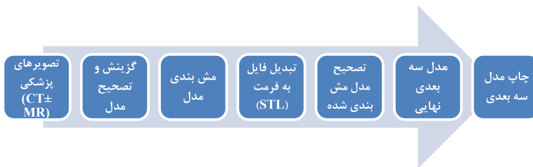
شکل ۱- فرآیند ایجاد یک مدل فیزیکی سه بعدی با استفاده از فناوری چاپ سه بعدی براساس داده‌های تصویربرداری پزشکی