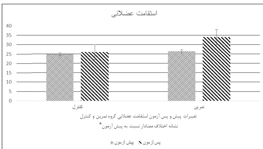
شکل ۳- تغییرات استقامت عضلانی در دو گروه تمرین و کنترل بعد از اعمال مداخله هشت هفته‌ای تمرینات پیلاتس

طریق فعال سازی مسیر وابسته به Foxo3 انجام می‌دهد و کاهش استرس اکسایشی ناشی از این مسیر نقش محافظتی در برابر التهاب ریوی در افراد مبتلا به بیماری‌های ریوی دارد. که در پژوهش حاضر Foxo3 اندازه‌گیری نشده است که به عنوان محدودیت مطالعه حاضر می‌باشد. از طرفی برخی مطالعات با یافته مطالعه حاضر هم خوانی ندارد. گورد و همکاران پس از ۶ هفته تمرین اینتروال شدید با شدت ۹۰ درصد اکسیژن مصرفی اوج نشان دادند که سطح سرمی Sirt-1 تغییر نکرد (۲۳). از علل این تناقضات می‌توان به نوع تمرین، شدت تمرین، نوع آزمودنی‌ها و سطح آمادگی افراد اشاره کرد (۲۴). از یافته‌های دیگر مطالعه حاضر می‌توان به افزایش