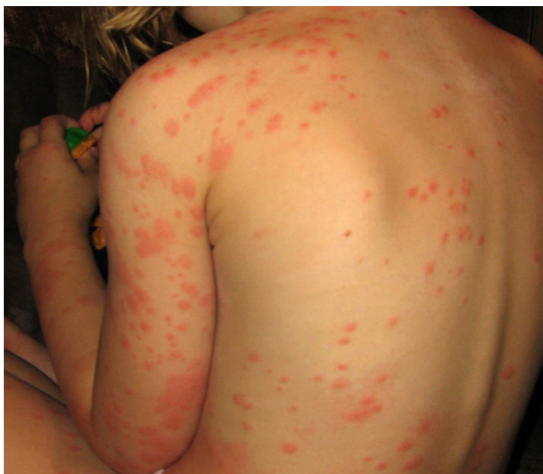
شکل ۳- گزیدگی توسط صدها ساس lectulariusbed

صورت بالقوه جدی هستند اما درک پایینی از آنها وجود دارد.