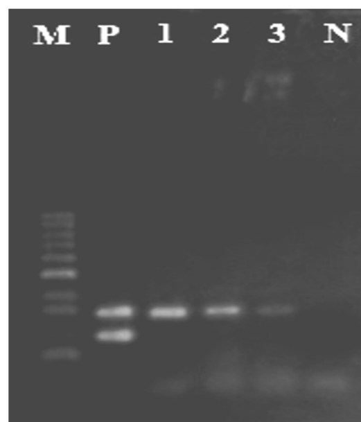
شکل ۳- الکتروفورز حاصل از Duplex PCR ژن cpa و cpe M مارکر مولکولی ۱۰۰bp، P جدایه کلوستریدیوم پرفرنزنس ۱۰۶۱۵۷ واجد ژن cpa و cpe ، N کنترل منفی (فاقد DNA ژنومی)، ۱-۳ جدایه‌های کلوستریدیوم پرفرنزنس جدا شده از سبزیجات خشک واجد ژن cpa (324bp) و فاقد ژن cpe (233bp)

می‌باشد. چون فاصله اطمینان عدد یک را در بر نمی‌گیرد بنابراین نوع بسته‌بندی با وجود باکتری ارتباط