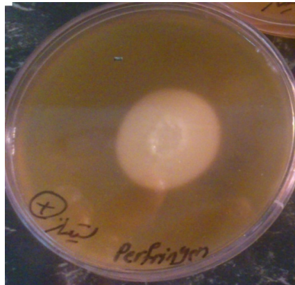
شکل ۲- کلستریدیوم پرفرنژنس لسیتیناز مثبت روی محیط Egg yolk agar

کلستریدیوم پرفرنژنس در سبزیجات خشک از نظر ژن آنروتوکسین ( cpe ) می‌باشد.