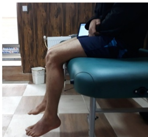
شکل ۱- نحوه نشستن برای ارزیابی حس وضعیت مفصل زانو

روی دیوار کنار فرد مورد مطالعه علامت گذاری می‌شد تا آزمونگر بتواند پای آزمودنی را تا محدوده‌ی مورد نظر بالا ببرد. اگرچه در این روش ممکن است زاویه آزمون مورد نظر دقیقاً توسط آزمونگر به طور غیر فعال ساخته نشود ولی به پیشنهاد استیلمن (۲۱)، از آنجا که فرد همان زاویه‌ای را که به او نشان داده می‌شود را بازسازی می‌کند، از این نظر اختلالی در نتایج آزمون ایجاد نمی‌گردد. پس از آن زانو توسط آزمونگر به وضعیت استراحت (۹۰ درجه فلکشن) برگردانده می‌شد. سپس آزمودنی زاویه مورد نظر را با همان اندام به صورت فعال، بدون استفاده از بینایی و فقط با اتکا به حس عمقی بازسازی می‌کرد. مقدار خطای فرد در بازسازی زاویه هدف به عنوان خطای حس وضعیت مفصل ثبت می‌شد. در این مطالعه زاویه ۴۵ درجه به عنوان زاویه هدف برای بازسازی انتخاب شد (۲۵). زمان استراحت بین آزمون یک دقیقه است. آزمون برای هر آزمودنی سه بار تکرار و میانگین خطای بازسازی طی سه بار اندازه‌گیری، خطای بازسازی زاویه برای آن زاویه در نظر گرفته می‌شد.