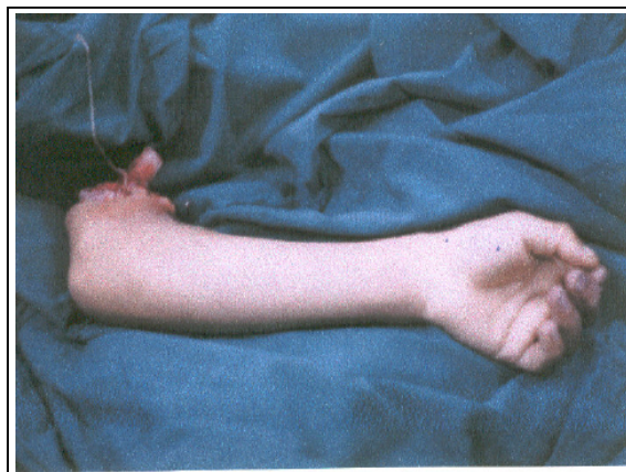
شکل شماره ۱- اندام فوقانی قطع شده از ناحیه بازو (به عصب مدین بیمار توجه شود)

اولنار از ناحیه ساعد و بازو جدا شده و به استامپ آمپوتاسیون آویزان بود (شکل شماره ۱).