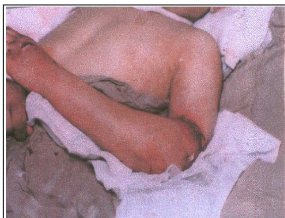
شکل شماره ۳- روز هفتم پس از عمل، اندام فوقانی زنده است دارای نبض است و ادم کاهش یافته اما پوست محل آمپوتاسیون دچار اریتم شده است.

در حال حاضر حدود ۲/۵ ماه از عمل بیمار می‌گذرد، جهت بهبود وضعیت حسی و حرکتی اندام فوقانی با همکاران