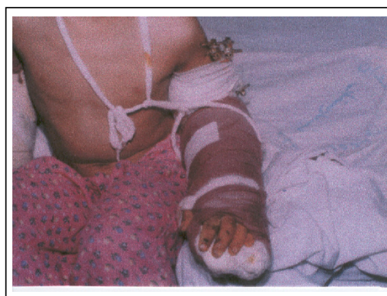
شکل شماره ۴- حدود روز دهم پس از عمل خروج پین‌ها، گذاشتن اکسترنال فیکساتور انجام شده، ناحیه ایسکمیک پوست خلف بازو دبریدمان شده است.

علی‌رغم مطلوب بودن وضعیت ناحیه ساعد و دست، به علت نکروز پوستی خط ترمیم در وسط بازو، شکستگی استخوان و پین‌های متقاطع به صورت شکستگی باز در معرض دید قرار گرفت (شکستگی به نوع باز تبدیل شد)، با توجه به وضعیت پیش آمده و با صلاحدید همکار محترم ارتوپد، بیمار به اطاق عمل منتقل شد، پین‌ها خارج گردید و جهت بی‌حرکتی استخوان، اکسترنال فیکساتور گذاشته شد. همزمان با این عمل، محل فاشیاتومی نیز گرافت شد و پس از این، زخم ناحیه خلف بازو به صورت یک شکستگی باز مورد Management قرار گرفت (شکل شماره ۴).