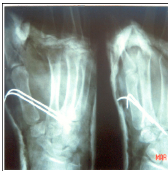
شکل شماره ۲- رادیوگرافی پس از عمل، جاناندازی نسبتاً خوب هر دو شکستگی(تاریخ مربوط به زمان تهیه اسلاید است).