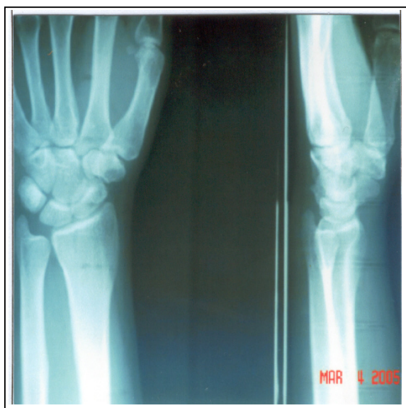
شکل شماره ۳- رادیوگرافی انجام شده ۱/۵ سال پس از ترومای اولیه