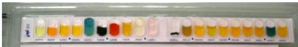
شکل ۱- کیت API-20E سیتروباکتر فروندی

از مردان و ۴۸٪ (۵۷/۱) جدایه از زنان با میانگین سنی بیماران ۲۴ سال به دست آمد.