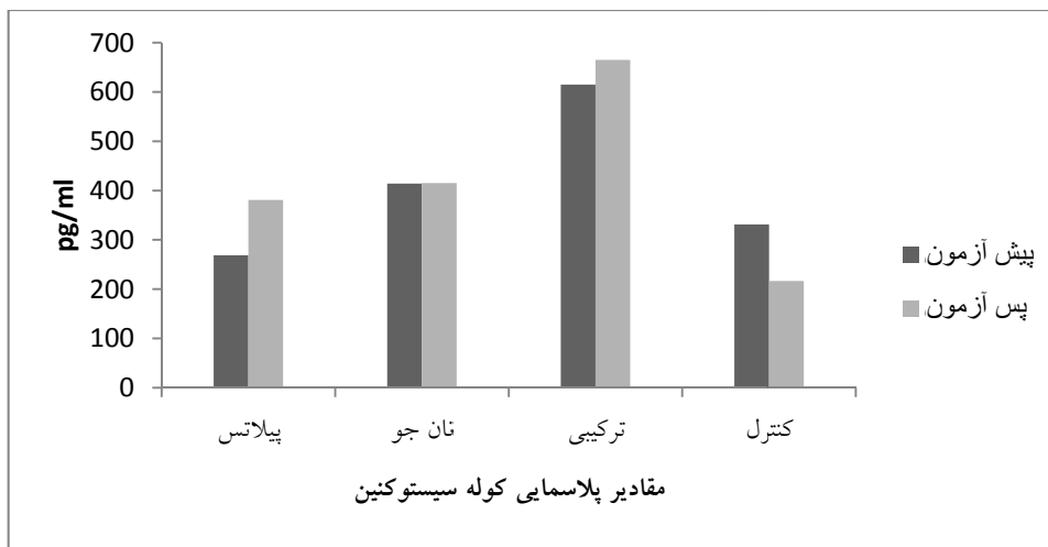
نمودار ۲- میانگین مقادیر پلاسمایی کوله سیستوکینین در چهار گروه مورد مطالعه در پیش آزمون و پس آزمون

نیستند (۲۴). شاید علت اصلی، در کاهش نیافتن دور کمر در تحقیق حاضر عدم کنترل رژیم غذایی و مدت زمان و شدت تمرین و جنسیت بوده باشد. در رابطه با تأثیر تمرین پیلاتس بر فاکتورهای مذکور، این یافته‌ها با نتایج هاشمی و همکاران که گزارش کردند تمرین پیلاتس باعث کاهش معنی‌دار وزن و BMI در زنان چاق می‌شود (۱۹) و همچنین با یافته‌های زکوی و همکاران که گزارش کردند مقادیر وزن و BMI متعاقب انجام ۶ ماه تمرین پیلاتس در مردان سالمند چاق به‌طور معنی‌داری کاهش می‌یابد (۱۱)، همخوانی دارد، اما در مورد WHR همخوانی ندارد. در تحقیقاتی مخالف، اعظمیان جزئی و همکاران (۱۸) در سال ۱۳۹۴ و صارمی و همکاران (۲۰) در سال ۱۳۹۳ گزارش کردند تمرینات پیلاتس بر کاهش وزن و BMI اثر معناداری ندارد. دلیل این ناهمخوانی می‌تواند به علت نوع آزمودنی‌های انتخابی باشد. نتایج تحقیق حاضر نشان داد مصرف \beta گلوکان جو باعث کاهش معنی‌دار وزن و BMI در زنان دارای اضافه وزن می‌شود. نتیجه حاضر با نتایج تحقیق مختاری و همکاران تحت عنوان بررسی تأثیر پاسخ تمرین هوازی و بتا گلوکان جو بر گلوکز خون، ترکیب بدنی و فشارخون زنان دیابتی موافق بود. در تحقیق ذکر شده میانگین وزن بدن آزمودنی‌ها در گروه تمرین و تغذیه 3/6 درصد کاهش یافت. از آنجایی که غذاهای غنی از فیبر معمولاً محتوای انرژی پایین‌تری دارند، به کاهش چگالی انرژی از مواد غذایی کمک می‌کنند. غذاهای غنی از فیبر نیاز به