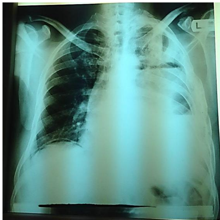
تصویر ۱- نمای ورود لوپ روده به حفره قفسه سینه چپ در رادیوگرافی ساده قفسه سینه

تنگی نفس بیمار نیز از ۲۰ روز قبل از مراجعه آغاز شده و همراه با سرفه و خلط غلیظ سفید رنگ بوده است. بیمار سابقه تروما به قفسه سینه را در حدود ۵ سال قبل عنوان کرده که به دنبال تروما