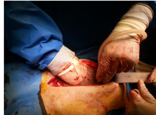
تصویر ۳- حین عمل پارگی دیافراگم و ورود کولون به حفره نیمه چپ قفسه چپ

می باشد، هرنی تروماتیک دیافراگم می تواند سال ها بعد از رخ دادن تروما خود را نشان داده و بدون علامت باقی بماند و به همین دلیل تشخیص هرنی دیافراگماتیک نیازمند حساسیت و تبصر خاص می باشد. اکثر علائم آن نیز ناشی از فتق احشاء به درون توراکس می باشد.