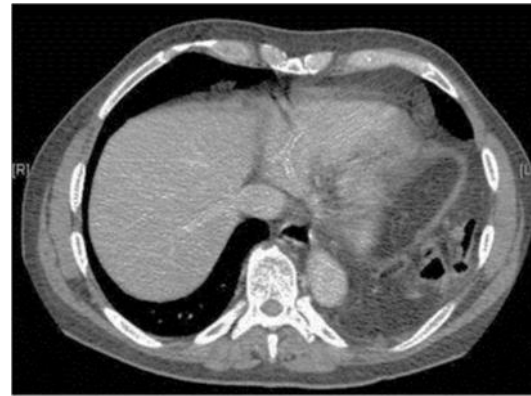
تصویر ۲- سی تی اسکن: ورود لوپ کولون به قفسه سینه چپ