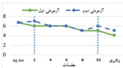
نمودار ۱- روند تغییرات دو آزمودنی در زیرمقیاس نقص توجه CSI-4