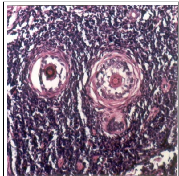
تصویر شماره ۳- ارتشاح سلول‌های لوکمیک اطراف ضمام پوستی