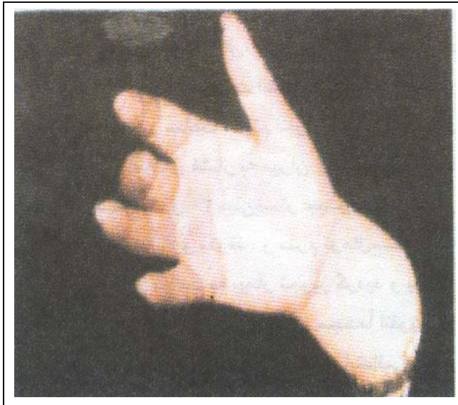
شکل ۲-ب: وضعیت انگشتان دست بیمار دو ماه بعد از درمان با آلپروستادیل