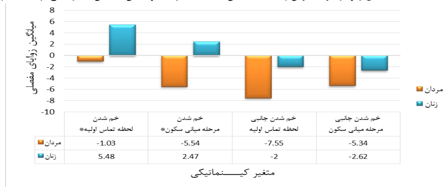
نمودار ۲- زوایای بدست آمده تنه در حرکت برش (علامت * نشان دهنده معناداری تفاوت بین میانگین ها در سطح (p \leq 0.05) بوده است).

تحقیق حاضر بر روی جمعیت اسکواش کار حرفه ای و ملی پوش کشور انجام شده. مانور برش به وفور ورزش اسکواش به کار می رود اما تحقیقی با ویژگی های کینماتیکی این بازیکنان شکل نگرفته است. این تحقیق علاوه بر اختلاف جنسیت به صورت جزئی به رخدادهای کینماتیکی بدن در حین انجام این مانور در بین ورزشکاران پرداخته است. در عین حال تحقیقات مشابه کمتر بطور جامع و همزمان روی اندام تحتانی و فوقانی آنالیز ویدئویی انجام داده است. همچنین داده های خروجی مطالعه پیش رو به صورت جزئی در لحظات تماس و میانی سکون استخراج شده است.