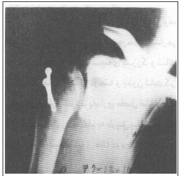
شکل شماره ۳- رادیوگرافی شانه ۶ ماه بعد از جراحی باز شانه

بیمار قادر است کارهای روزمره خود را براحتی انجام دهد. رادیوگرافی اخیر نیز علائمی از نکروز آسپتیک را نشان نداد (شکل شماره ۳).