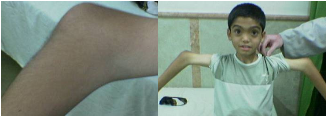
شکل ۱. تصویر الف پسر ۵ ساله ای را نشان می‌دهد که به علت دررفتگی آرنج دو طرف دامنه حرکتی محدود دارد. تصویر ب زانوی راست همین کودک را نشان می‌دهد که دررفته می‌باشد و محدودیت حرکتی دارد.

از ده بیمار مذکور، هیچ یک اسکولیوز و کیفیت گردنی نداشتند. پنج مورد شلی لیگامانی داشتند و