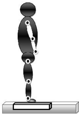
تصویر ۱- وضعیت شروعی آزمون