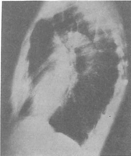
شکل شماره ۲: تصاویر رادیولوژیک ستون فقرات مربوط به دو بیمار مبتلا به پرولاپس دریچه میترال