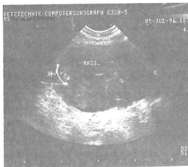
شکل ۲- سونوگرافی شکم بیمار که یک توده مدور با اکوژنیسیته مختلط دیده می شود.

رحمی نیز مهار گردیده بود. در روز سرم بستری در ناحیه ربع تحتانی راست شکم و اطراف ناف خصوصاً در سمت راست ناحیه اکیموتیکی بوجود آمد که تدریجاً وسعت آن افزایش یافت