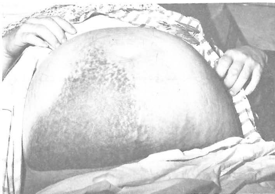
شکل ۱- اکیموز در پوست شکم بیمار

رحمی نیز مهار گردیده بود. در روز سرم بستری در ناحیه ربع تحتانی راست شکم و اطراف ناف خصوصاً در سمت راست ناحیه اکیموتیکی بوجود آمد که تدریجاً وسعت آن افزایش یافت