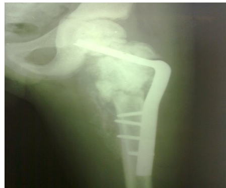
شکل ۴- ثابت کردن مجدد شکستگی و اصلاح و آروس