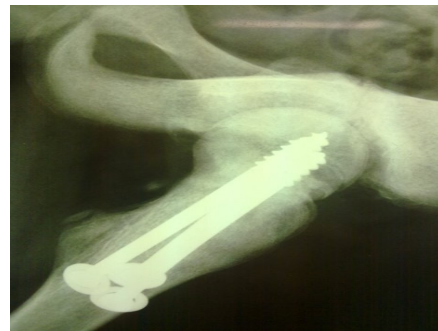
شکل ۲- شکل نیم‌رخ پس از عمل اول