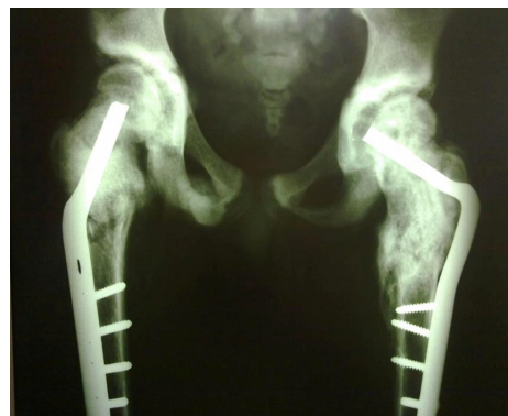
شکل ۵- شکل رخ لگن بعد از ثابت کردن شکستگی طرف مقابل

عمل اول دچار شکستگی ساب تروکانتریک در همان سمت و هم‌زمان و آروس شدن گردن فمور شد (شکل شماره ۳). لذا برای بار دوم تحت عمل جراحی قرار گرفت این بار ابتدا پیچ‌های قبلی خارج شد سپس دفورمیتی و آروس از محل قبلی شکستگی گردن فمور اصلاح شد و بعد هر دو محل شکستگی با angle blade فیکس شد (شکل شماره ۴). سه ماه بعد از این عمل مجدداً به دنبال زمین خوردن این بار از سمت مقابل دچار شکستگی ساب تروکانتریک شد. این شکستگی نیز با استفاده از angle blade فیکس شد (شکل شماره ۵). نکته قابل توجه در هر سه عمل جراحی انجام شده سخت بودن بیش از حد استخوان به دلیل استئواسکلروز و هم‌زمان شکننده بودن آن بود.