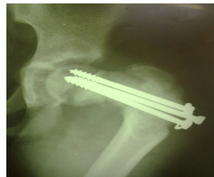
شکل ۳- بعد از زمین خوردن مجدد (دفورمیتی واروس)

تشخیص استئودیستروفی رنال ثانویه بیوپسی از استخوان می‌باشد. (۵) با توجه به اینکه بیوپسی استخوان روشی تهاجمی محسوب می‌شود عمدتاً از مارکرهای سرولوژیک و شکل ساده در تشخیص استفاده می‌شود. در جمع آوری ۲۴ ساعته ادرار میزان اگزالات بالای ۲۰۰ میلی گرم می‌باشد. از تظاهرات سرولوژیک استئودیستروفی رنال ثانویه فسفر بالا و کلسیم پایین تا نرمال و افزایش هورمون پاراتورمون می‌باشد. در بررسی رادیولوژیک طیف گوناگونی از تغییرات استخوانی مشهود است. دسته اول تغییرات استخوانی ثانویه به اگزالوسیس و شامل