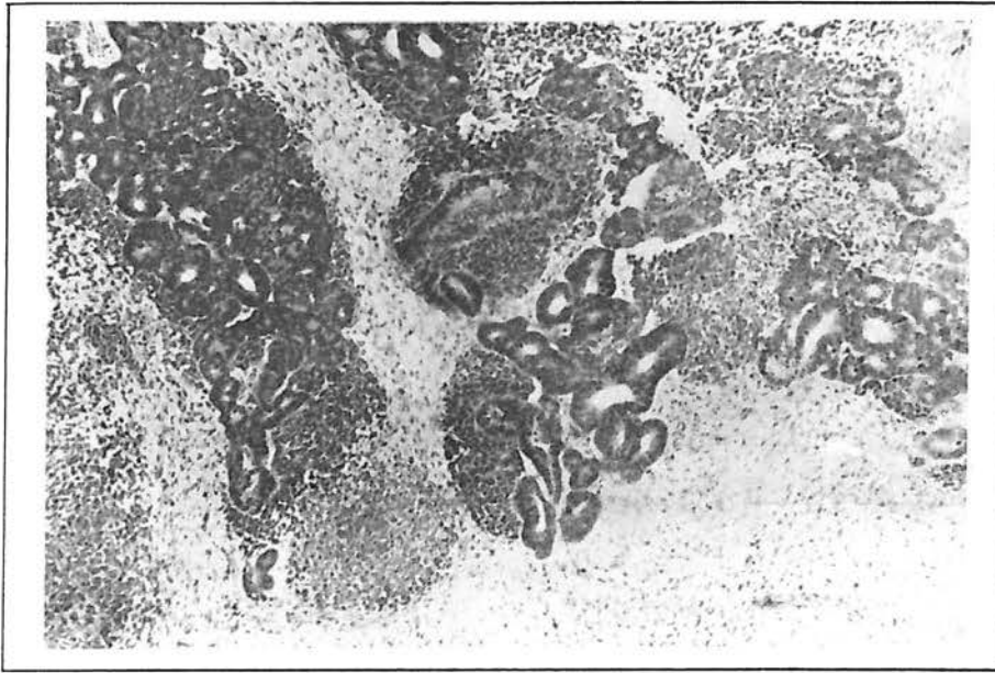
شکل ۱- نمونه مساعد هیستولوژیک تومور ویلمز

تومور توسط Shamberger و همکاران ظرف ۱۴ سال (۹۱-۱۹۷۸) در بیمارستان کودکان بوستون در ماساچوست آمریکا صورت گرفته است که در آن ۱۱۴ کودک را که تومور کلیه داشتند تحت بررسی قرار دادند. در این بررسی ۹۱ بیمار (۸۰ درصد) دارای هیستولوژی مساعد (شکل یک) و ۲۳ بیمار (۲۰ درصد) دارای هیستولوژی نامساعد بودند. اصولاً علت اصلی جدا کردن تومور ویلمز به دو دسته مساعد و نامساعد مشاهده بعضی تغییرات بافتی در گروهی از این تومورها بود که به تیمی درمانی نیز مقاومت بیشتری نشان می دادند و پیش آگهی وخیم تری نیز دارا بودند که