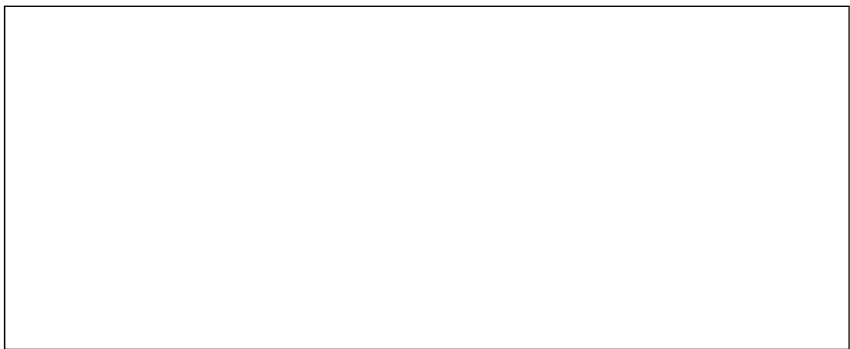
شکل شماره ۱- دیسپلازی فیبرو تشکیل شده از ترابکولهای استخوانی در هم تنیده (Women) که فاقد حاشیه استئوبلاستیک برجسته بوده و در زمینه‌ای از بافت همبند قرار دارد.

بیمار خانم ۳۰ ساله و مجردی بود که ۲۴ سال قبل در سن ۷ سالگی به علت توده فک فوقانی چپ (Maxilla) که سبب تغییر شکل ظاهری صورت شده بود با تشخیص پاتولوژیک دیسپلازی فیبرو تحت عمل جراحی قرار گرفته بود. بیمار مبتلا به شکاف لب و کام مادرزادی نیز بود که عمل جراحی ترمیمی برای وی انجام شده بود همچنین ضایعات متعدد هیپوپیگمانه روی تنه و اندامها (vitiligo)