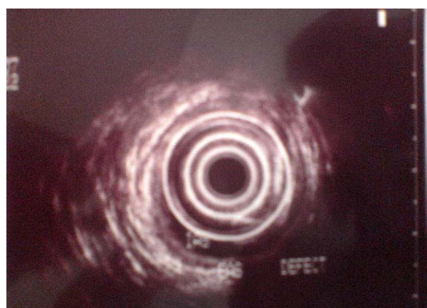
تصویر شماره ۲- جابجایی ناقص رکتوم به علت نقص اسفنکتر مقعد در سونوگرافی اندوانال

درمان جابجایی کامل یا جدا بودن اسفنکتر از آنورکتوم (Complete mislocation) با قرار دادن رکتوم در میان عضله اسفنکتر (Relocation) انجام پذیراست. این روش درمانی برای اولین بار توسط Alberto Pena گزارش شده است. (۳و۲) در نوع Partial mislocation، درمان بی‌اختیاری با ترمیم عضله اسفنکتر مقعد میسر می‌گردد. تعیبه کلتومی به مدت یک ماه در هر دو حالت توصیه می‌شود.