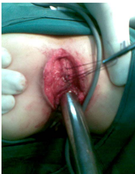
تصویر شماره ۵- جابجایی ناقص رکتوم به علت نقص اسفنکتر مقعد پس از ترمیم

حلقوی در ساعت ۹ دیده شد. معمولاً آخرین بررسی بیماران در زیر بیهوشی با Muscle stimulator (تصویر شماره ۵) بوده و در ۲ مورد اسفنکتر مقعد، خارج از دهانه رکتوم و در کنار آن (Complete mislocation) قرار داشت (تصویر شماره ۳). نقص حلقوی اسفنکتر مقعد در ۵ مورد در ساعت ۱۲ (تصویر شماره ۴)، در ۲ بیمار در ساعت ۱، ۶ مورد در ساعت ۳ و در یک بیمار در ساعت ۹ مشاهده گردید (جدول شماره ۱).