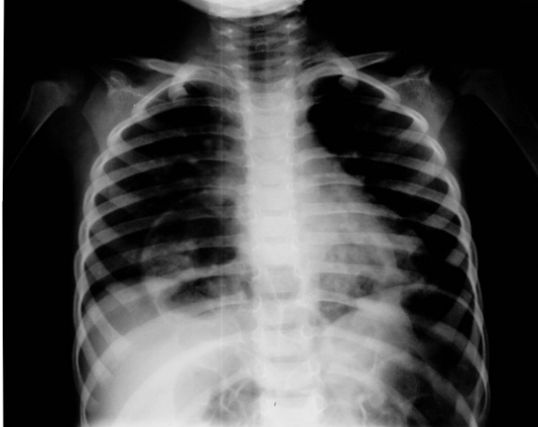
شکل شماره ۱- عکس قبل از عمل که لوپ‌های کولون در حاشیه راست قلب دیده می‌شود.

کولون به سمت شکم جا انداخته شد و نقص موجود در دیافراگم با سوچورهای نایلون ۱-۰ ترمیم شد. پس از جراحی حال عمومی بیمار خوب بوده و در طی یک سال و نیم پیگیری، بیمار بدون علامت بوده و مشکل خاصی ندارد.