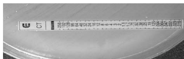
شکل شماره ۱: MIC نوار سفوتاکسیم (به مقاومت بالای ایزوله توجه کنید)

در مورد نتایج E-test، دانستن این نکته قابل توجه بود که هیچ حساسیتی در این ۴۰ ایزوله نسبت به آنتی‌بیوتیک سفوتاکسیم وجود نداشت (شکل شماره ۱)؛ یعنی غلظت آنتی‌بیوتیک در نوارهای E-test سفوتاکسیم که برابر با میزان ۲۵۶µg می‌باشد، هیچ اثر مهارکنندگی در رشد نداشت.