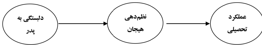
شکل ۱- مدل پیشنهادی رابطه دلبستگی به والدین و عملکرد تحصیلی با میانجی‌گری نظم‌دهی هیجان

۰/۸۰ دلبستگی به پدر ۰/۷۹ و دلبستگی به همسالان ۰/۹۰ بدست آمد.