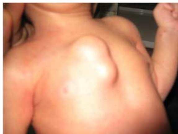
شکل شماره ۱- تصویر توده جدار قفسه سینه در نوزاد مورد بررسی

در سی تی اسکن اسپیرال که بیمار به همراه داشت افیوژن و ضایعات تومورال ندولار نداشت و ریه‌ها نیز نرمال بودند (شکل شماره ۲).