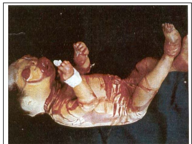
تصویر شماره ۴- نوزاد دختر، لبهای برگشته، پلکهای برگشته و انتهای آتروفیک

نوزاد داخل انکوباتور گرم و مرطوب قرار گرفت و شرایط جداسازی و استرلیزاسیون رعایت گردید. برای نوزاد، مایع، اکسیژن و آنتی بیوتیک لازم تجویز شد و بیوپسی از پوست نیز صورت گرفت که نتیجه آن هایپرکراتوز شدید بود. روز بعد نوزاد با تابلوی زجر تنفسی فوت کرد.