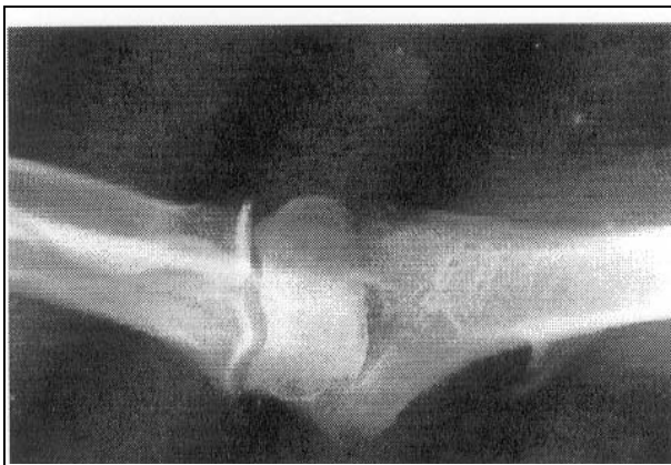
تصویر شماره ۱- رادیوگرافی خار سوپراکوندیلار

در رابطه با علائم نینز در بررسی Visual Analogue Scale درد بیمار کاهش یافته بود.