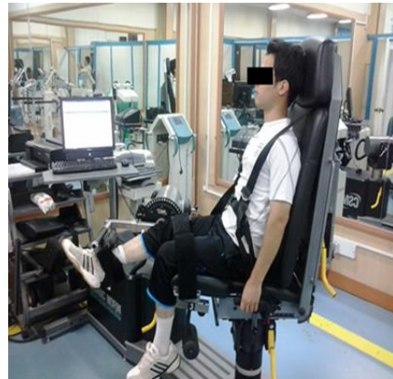
شکل ۲- نحوه ارزیابی قدرت عضلات اطراف زانو