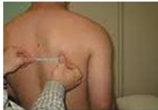
تصویر ۱- نحوه اندازه‌گیری فاصله کتف از ستون فقرات در وضعیت اول (حالت صفر درجه)

هر حرکت سه بار تکرار و بیشترین مقدار به عنوان حداکثر قدرت توسط دستگاه ثبت می‌شود. لازم به ذکر است که بازخوردهای گفتاری مکرراً در طول مراحل انجام آزمون به منظور استفاده فرد از حداکثر قدرت خود به کار گرفته می‌شود. مدت نگره داری هر انقباض با توجه به نوع برنامه انتخاب