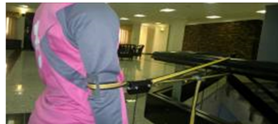
تصویر ۲- حرکت اکستنشن بازو