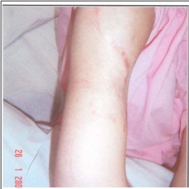
تصویر شماره ۴- ادم آرنج دیستال به اسکارهای Constriction Band

اسکارهای جراحی‌های قبلی در ساعد و بازو قابل مشاهده بود همچنین یک ناحیه آتروفیک به شکل دایره در بالای بازوی راست به شکل "Constriction band" وجود داشت (تصویر شماره ۵). ادم گوده‌گذار بود، بیمار توانایی حرکت دادن اندام فوقانی راست را نداشت و تلاش برای حرکت دادن غیرفعال (پاسیو) با درد شدید همراه بود. در معاینه، نبض‌ها و حس اندام طبیعی بود و رادیوگرافی ساده نیز طبیعی گزارش شد. در MRI، تورم بافت نرم بدون تومور مشاهده گردید و EMG، NCV، سونوگرافی داپلر شریان‌ها و وریدهای اندام فوقانی راست و نیز تست‌های آزمایشگاهی طبیعی بودند.