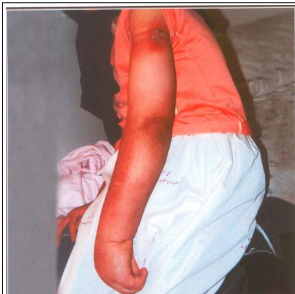
تصویر شماره ۲- وجود ۲ عدد Constriction Band در دست

سرانجام به علت سنگینی، حجم زیاد و بدون استفاده بودن (useless) اندام، آمپوتاسیون از محل مچ انجام شد (تصویر شماره ۳) که تشخیص آسیب‌شناسی Lymphangiectasis بود.