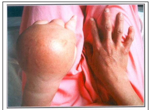
تصویر شماره ۱- ادم شدید دست بیمار

در موقع مراجعه به درمانگاه فیروزگر، در اندام فوقانی چپ در قسمت دیستال آرنج، ادم شدیدی وجود داشت که در دست بسیار شدیدتر و گوده‌گذار بود (تصویر شماره ۱).