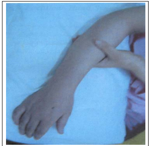
تصویر شماره ۶- بعد از برطرف شدن ادم