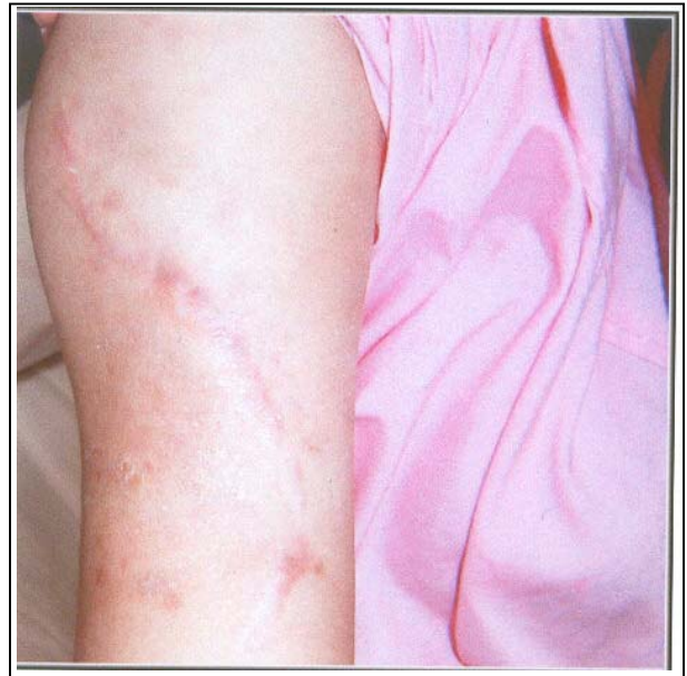
تصویر شماره ۵- دو عدد اسکار Constriction Band در پروگزیمال بازو

در مرحله بعد تصمیم گرفته شد تا مشاوره با روان‌پزشک صورت گیرد که این مسئله با مقاومت شدید همسر بیمار روبرو شد و بیمار با رضایت شخصی از بیمارستان مرخص گردید.