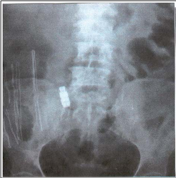
تصویر شماره ۳- کاتتر Coil در محل اصلی قرار گرفته است.