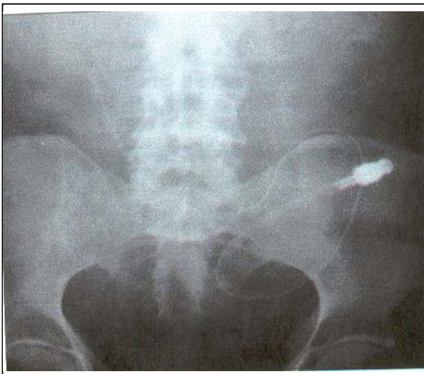
تصویر شماره ۴- حرکت کاتتر به سمت بالا در این تصویر دیده می‌شود

اگر چه دیالیز فوری پس از گذاشتن کاتتر بدون عارضه نشت کردن گزارش شده، توصیه می‌شود دیالیز ۱-۳ روز بعد از کاتتر گذاری و به شکل تزریق مایع دیالیز صفاقی به میزان ۱۵۰۰-۲۰۰ میلی‌لیتر صورت گیرد (اغلب به میزان ۵۰۰ میلی‌لیتر هر ۱ ساعت برای جلوگیری از تشکیل شدن فیبرین یا لخته خون) و پس از ۲ هفته دیالیز منظم شروع شود. (۹)