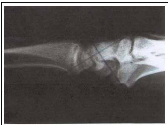
شکل شماره ۲- نمونه‌ای از رادیوگرافی با دفرمیتی دورسال