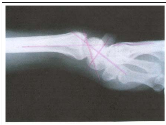
شکل شماره ۱- نمونه‌ای از رادیوگرافی با دفرمیتی پالمار