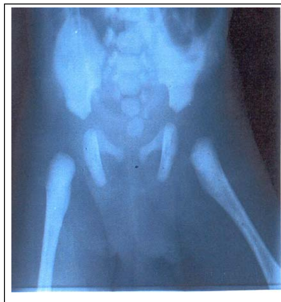
شکل شماره ۴- گرافی تحتانی شکم که نشان دهنده آنومالی‌های مهره‌ای و انسداد روده است.