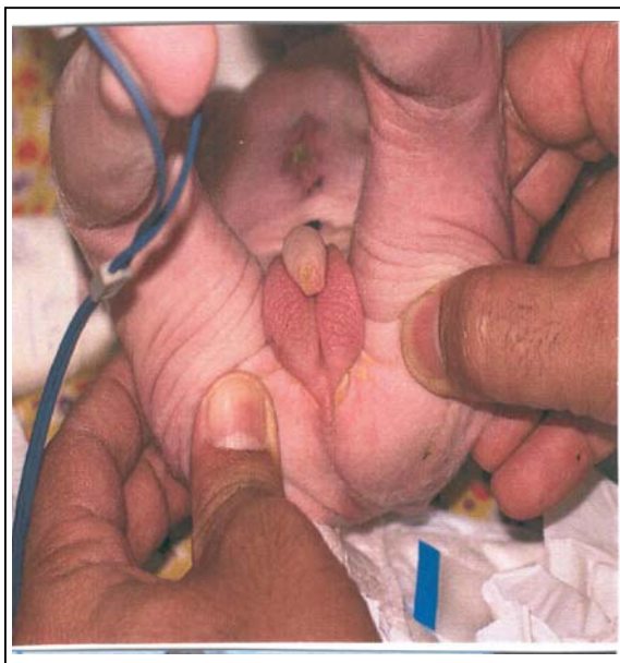
شکل شماره ۲- سوراخ و چین‌های مقعدی تشکیل نشده

وزن نوزاد، ۲/۵ کیلوگرم، قد وی، ۵۱ سانتی‌متر و دور سر وی، ۳۵ سانتی‌متر بود. در سمع قلب، یک سوفل سیستولیک جهشی در کانون پولمونر و در معاینه ریه‌ها، رال منتشر دو طرفه شنیده می‌شد. سوراخ مقعدی، تشکیل نشده و چین‌های مقعدی تکامل نیافته بود (شکل شماره ۲). در معاینه شکم، دیستانسیون واضحی دیده می‌شد ولی ارگانومگالی وجود نداشت. معاینه اندام‌ها و دستگاه تناسلی نیز فاقد هر گونه دفورمیتی یا آنومالی بود.