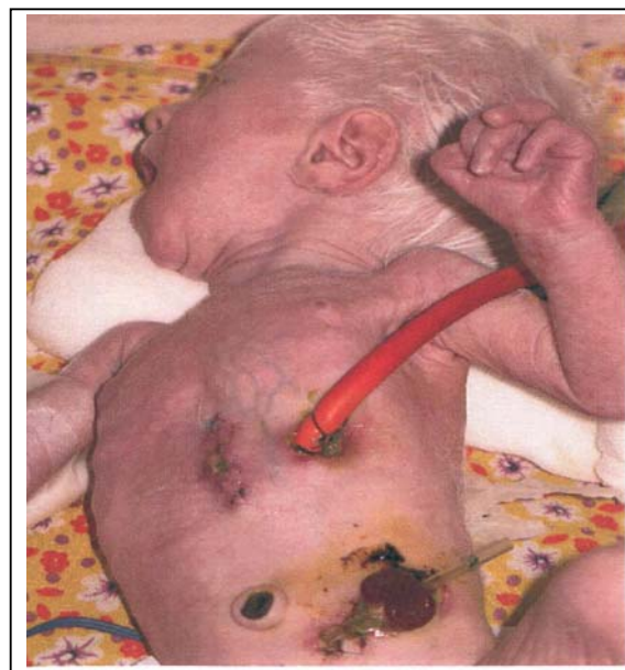
شکل شماره ۱- نوزاد مبتلا به آلبنیسم

در معاینات زمان پذیرش، پوست سفید منتشر، عنیبه خاکستری رنگ و موهای سفید ابرو و سر جلب نظر می‌کرد (شکل شماره ۱).