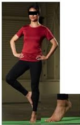
شکل ۲- ارزیابی تعادل ایستا با استفاده از تست لک لک