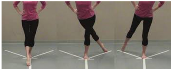
شکل ۳- ارزیابی تعادل پویا با استفاده از تست وای

سه جهت قدامی، خلفی-داخلی و خلفی-خارجی و با زوایای ۱۳۵، ۱۳۵ و ۹۰ درجه نسبت به هم انجام گردید. اندازه گیری بدین صورت انجام شد که آزمودنی با پای برتر روی دستگاه قرار می گرفت و با پای نوسان، قسمت متحرک دستگاه را تا حد امکان و بدون خطا (بلند شدن پای تکیه از زمین، تکیه روی پای نوسان، افتادن آزمودنی)، جابجا و از پای تکیه دور می کرد و در ادامه به حالت طبیعی روی دو پا برمیگشت. فاصله قسمت متحرک تا مرکز دستگاه به عنوان فاصله دستیابی در نظر گرفته شد. انجام تست در سه تکرار صورت گرفت و میانگین سه تکرار در هر جهت بر طول پای آزمودنی (بر حسب سانتیمتر) تقسیم و حاصل آن در ۱۰۰ ضرب شد و فاصله دستیابی بر حسب درصد اندازه طول پا برای هر جهت به دست آمد. امتیاز ترکیبی آزمودنی ها نیز از طریق جمع اعداد به دست آمده در سه جهت و تقسیم حاصل آن بر عدد سه، به دست آمد. همچنین Plisky ضریب پایایی درون آزمونگر و بین آزمونگر برای جهات مختلف را بین ۰/۸۵ تا ۰/۹۱ و ۰/۹۹ تا ۱/۰۰ و برای نمره کل نیز به ترتیب ۰/۹۱ و ۰/۹۹ گزارش کرده است (۳۶).